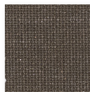
Art.nr. 43410 ③