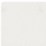
Art.nr. 43400 ③