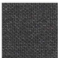
Art.nr. 43440 ③

Observera att vävarnas färgåtergivning inte är 100 % korrekt, ovan visar istället förhållandet mellan de olika vävarna. För korrekt återgivning hänvisar vi till fysiskt vävprov.