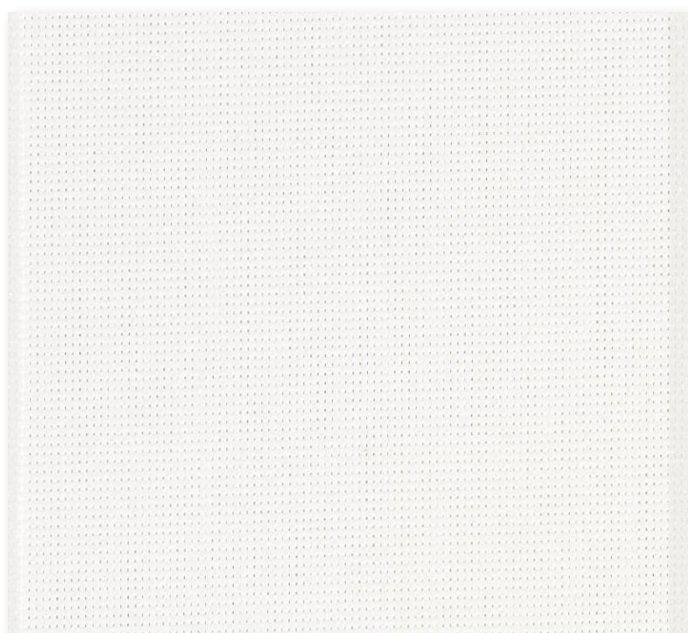
Art.nr. 43400 ③