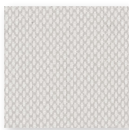
Art.nr. 43420 ③