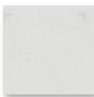
Art.nr. 1193 ②