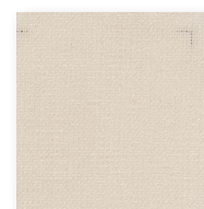
Art.nr. 1190 ②