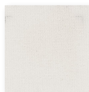
Art.nr. 3657 ②