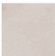
Art.nr. 1191 ②