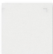
Art.nr. 3656 ②