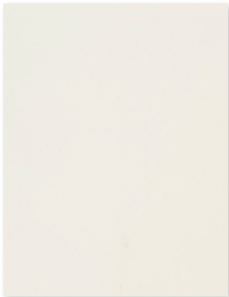
Art.nr. 3192590 ③