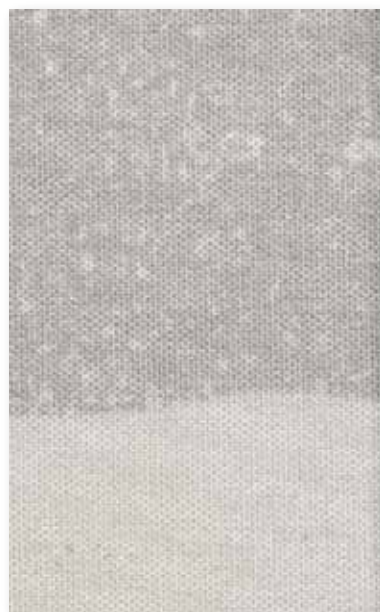
Art.nr. 3192795 ③

Observera att vävarnas färgåtergivning inte är 100 % korrekt, ovan visar istället förhållandet mellan de olika vävarna. För korrekt återgivning hänvisar vi till fysiskt vävprov.