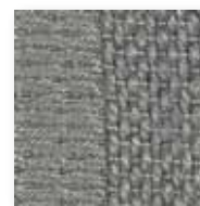
Art.nr. 3059095 *