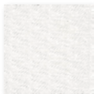
Art.nr. 3059090 *