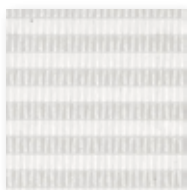
Art.nr. 3058090 ⑦