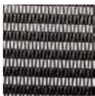
Art.nr. 3058098 ⑦

Observera att vävarnas färgåtergivning inte är 100 % korrekt, ovan visar istället förhållandet mellan de olika vävarna. För korrekt återgivning hänvisar vi till fysiskt vävprov.