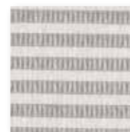
Art.nr. 3058094 ⑦